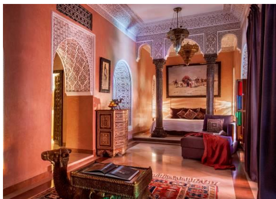
SUITE - 45 à 60 m 2 -1 Lit Supplémentaire possible -Espace privé devant la chambre