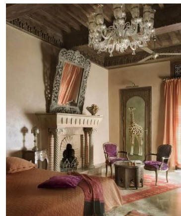
JUNIOR SUITE DELUXE - 40 à 45m 2 - Balcon privé