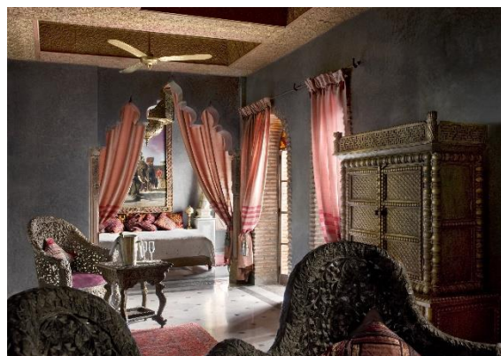
SUITE DELUXE - 60 à 75m 2 - 2 Lits Supplémentaires possibles - Balcon privé