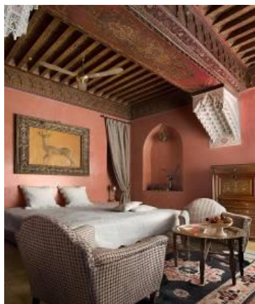
PRESTIGE DELUXE - 30 à 40m 2